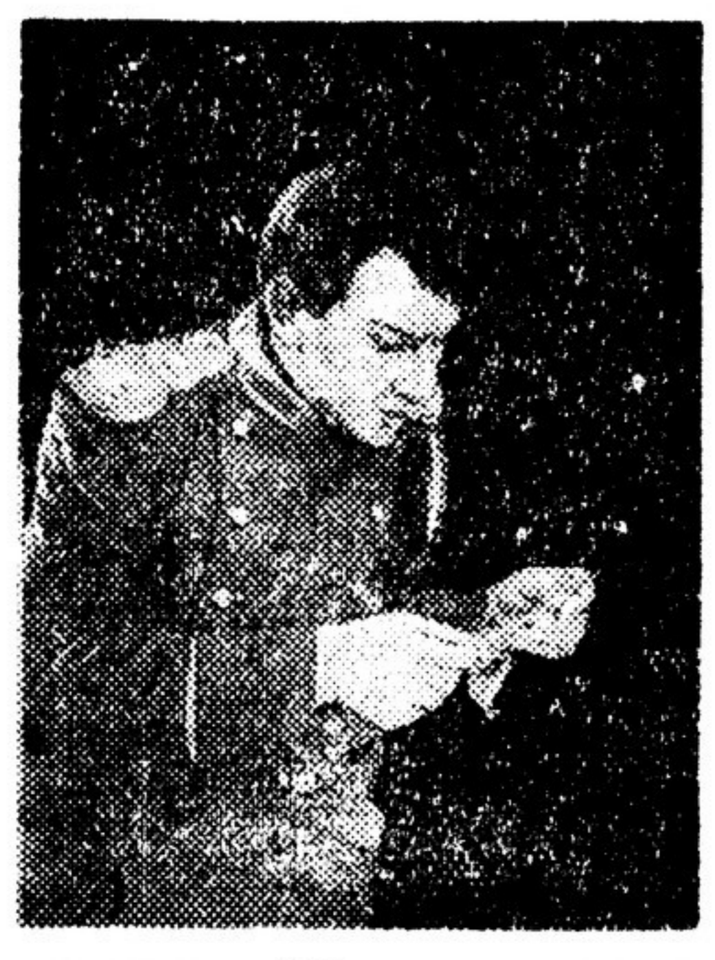
«ПИКОВАЯ ДАМА» в ленинградском Малом оперном театре (режиссер В. З. Мейерхольд). На фото: ГЕР...