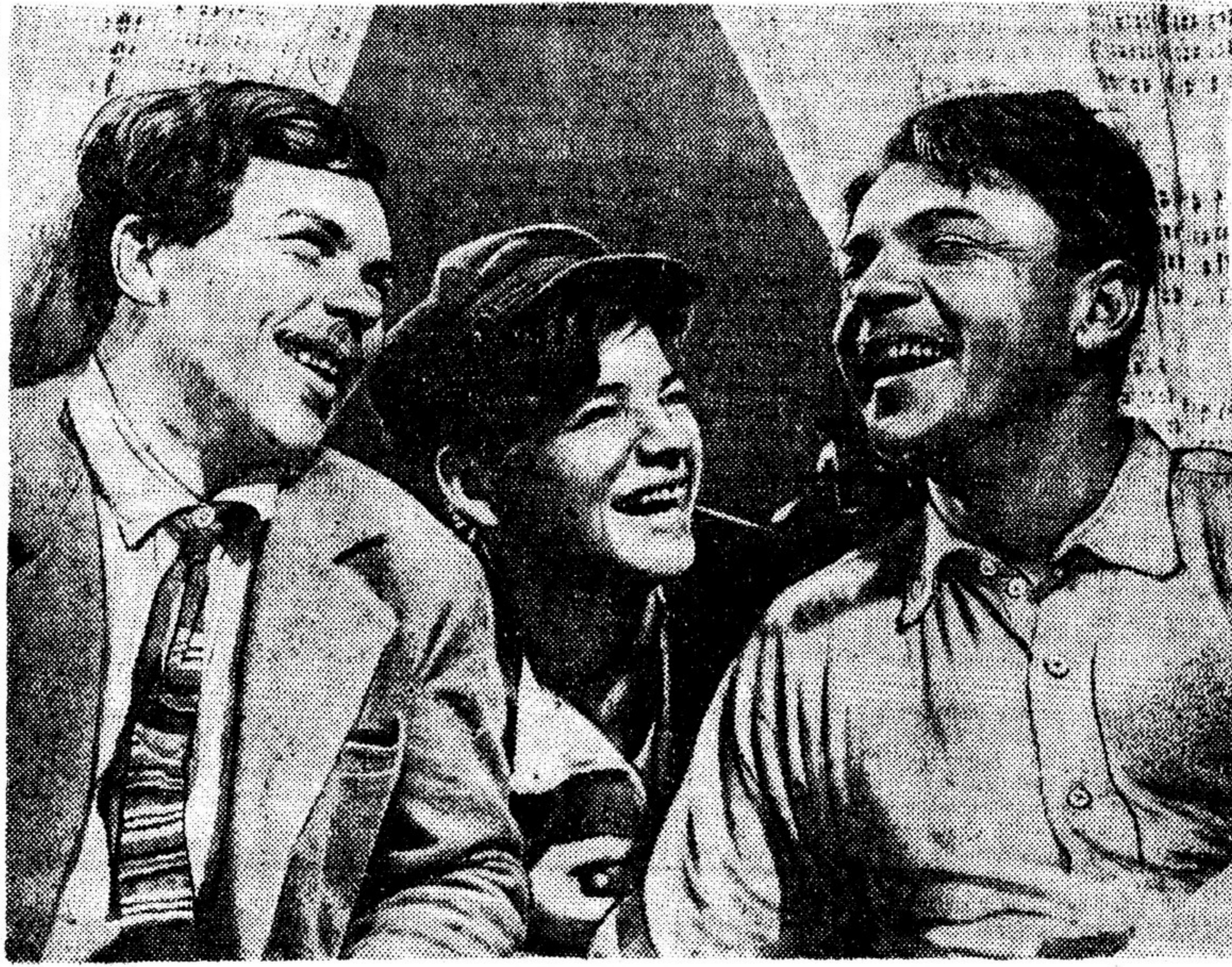
Кадр из фильма «КРЕСТЬЯНЕ». Режиссер — О. ЗЕМЛЕР.

Этим людям колхозной деревни, их простым и большим делам — наши творческие усилия, наша упорная работа над созданием новых больших полотен, живописующих величие становления социалистического сельского хозяйства в нашей стране под знаменем Ленина — Сталина.